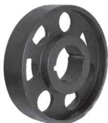
pro pouzdro TB (Taper Bush)

Řemenice upnuté na hřídele vytváří spolu s řemenem, kterým jsou opásány, mechanický řemenový pohon, sloužící k přenosu energie mezi jednotlivými hřídeli.